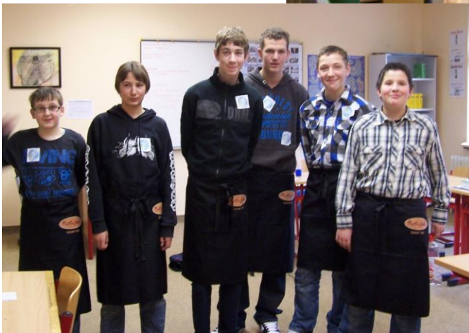
Schülerfirma Ruth's foods

Der Vorlesetag war eine sehr gelungene Aktion und fand großes Interesse in den Medien.